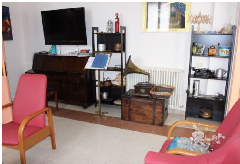
Fig. 4 Sala della musica