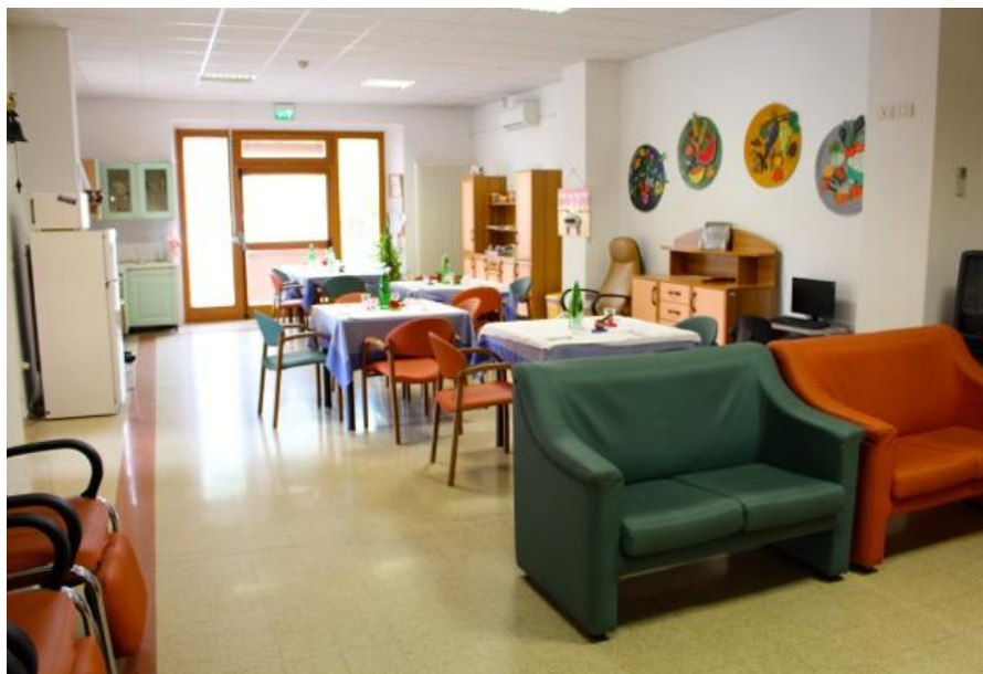
Fig. 2 Refettorio