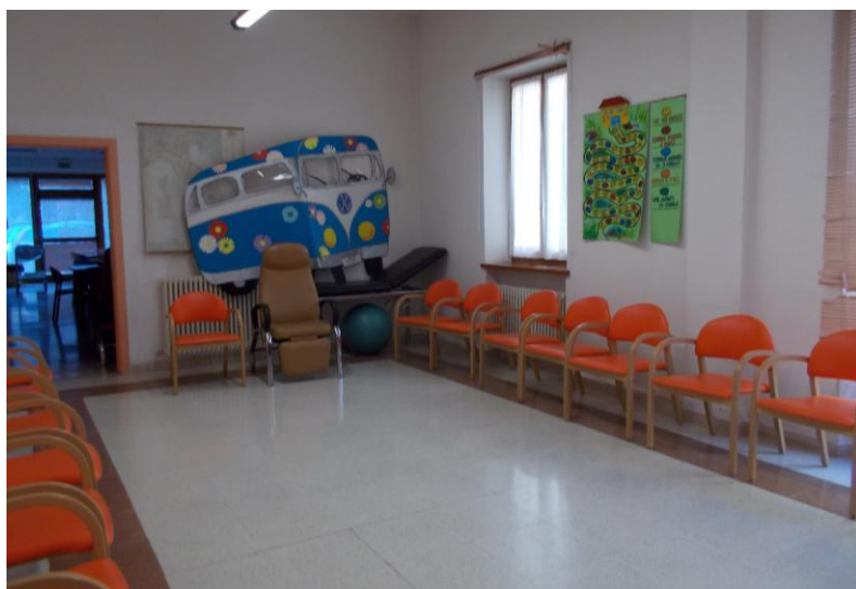
Fig. 3 Sala attività motoria