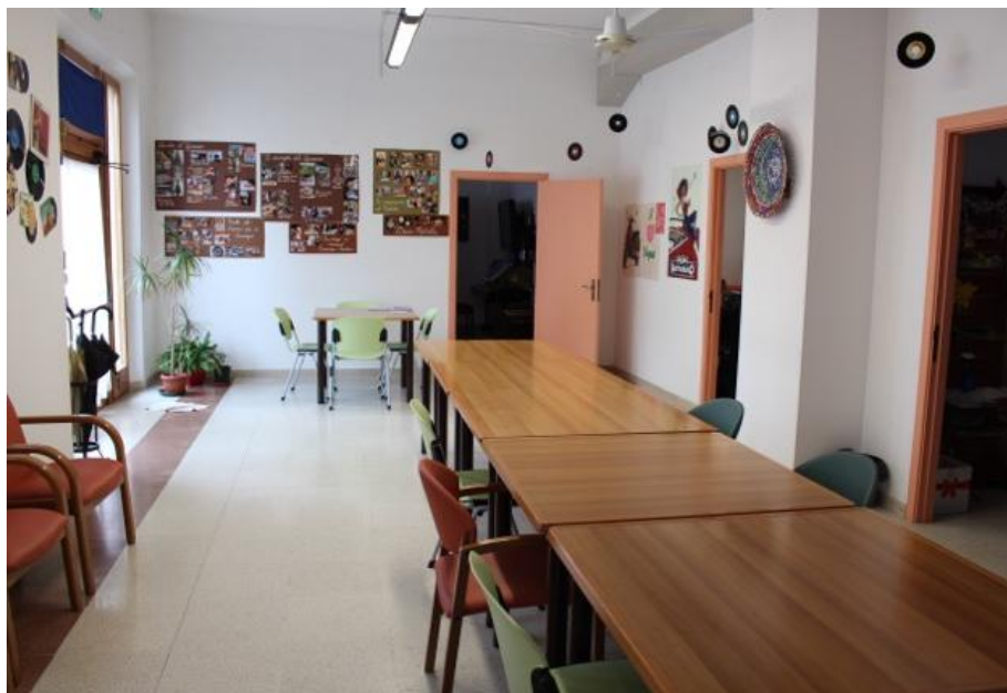
Fig. 1 Salone attività ricreative